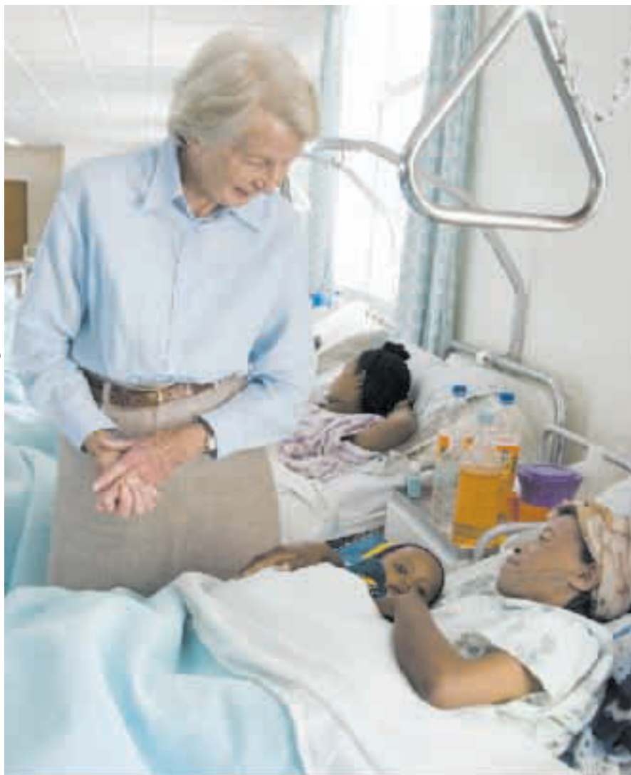
院長キャサリン・ハムリン医師

理解プロジェクト・サポーター、TICAD市民社会フォーラム会員などアフリカ関連のNGOに関わる。